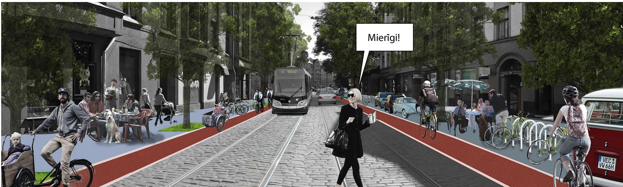
Miera ielas attīstības koncepcija "Mierīgi" (Fine Young Urbanists, "Miera ielas republika", LAIC)